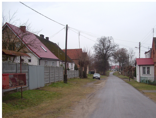
Fot. 6 Obecny stan infrastruktury drogowej i oświetlenia ulicznego