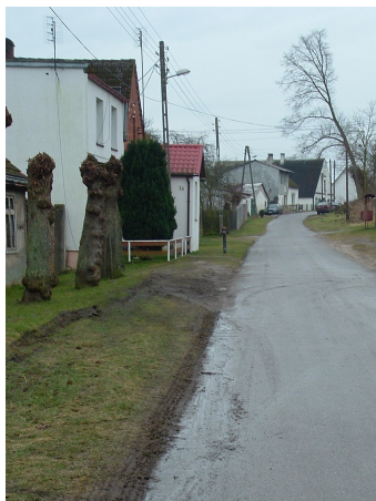
Fot. 3 Obecny stan infrastruktury drogowej i oświetlenia ulicznego