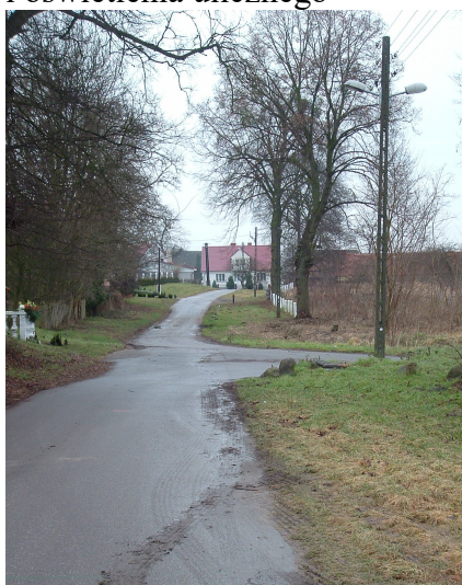
Fot. 5 Obecny stan infrastruktury drogowej i oświetlenia ulicznego