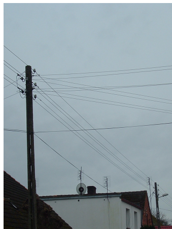
Fot. 4 Obecny stan infrastruktury drogowej i oświetlenia ulicznego