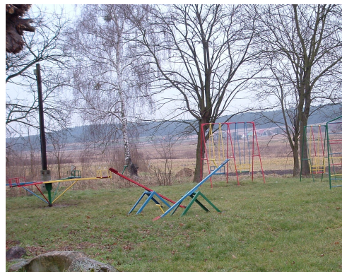
Fot. 2 Plac zabaw – stan obecny