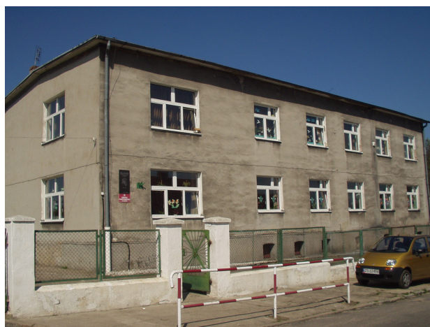
Rys. 3 Szkoła Podstawowa im. Marii Konopnickiej w Grzybnie

Szkoła odnotowana w 1868 r., prowadzona przez zakrystiana; budynek obecnie nie istnieje. Ok. 1960 roku szkoła została przeniesiona do pałacu gdzie mieściło się KPGR w Grzybnie. W 1969 roku zostaje wybudowana nowa szkoła. W 1980 r. po generalnym remoncie budynku SP w Grzybnie zostaje otwarta filia SP w Strzelczynie. W 2001 szkole nadano imię Marii Konopnickiej. W 2007r. zakończono przebudowę istniejącego budynku na salę gimnastyczną z zapleczem. W wyniku przebudowy istniejącego budynku przy udziale środków SPO-ROL oraz PAOW uzyskano salę gimnastyczną wraz z zapleczem o powierzchni użytkowej – 307,20 m 2 , salę ćwiczeń o powierzchni użytkowej – 36,10 m 2 , salę zebrań o powierzchni użytkowej 124,00 m 2 oraz mieszkanie o powierzchni użytkowej – 75,10 m 2 . Powierzchnia użytkowa całego obiektu - 615,5 m 2 , kubatura – 3491,0 m 3 .