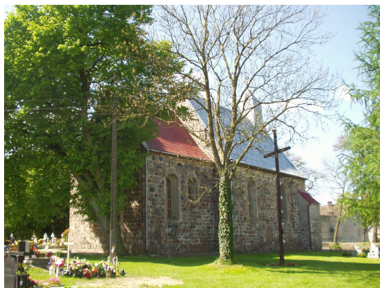
Rys. 2 Kościół w Grzybnie z XIII w.

Kościół - filia parafii w Baniewicach. Kościół zbudowany w XIII wieku. z kostki granitowej; budowa salowa z wyodrębnionym prezbiterium (na planie czworoboku); przebudowany na początku XVIII w. (wówczas postawiono wieżę w konstrukcji ryglowej). Odremontowany w 1946 r., obecnie pełni funkcję sakralną (kościół parafialny rzymsko-katolicki).