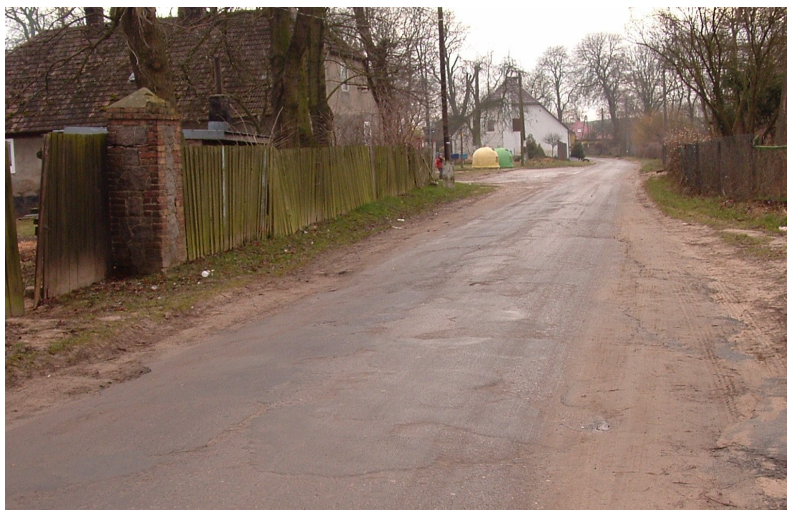
Widok na główną ulicę we wsi

Realizacja inwestycji przewiduje budowę jednostronnego chodnika lub budowy utwardzenia pobocza wzdłuż drogi powiatowej przebiegającej przez miejscowość Krajnik Górny, na odcinku o długości około 500 metrów.