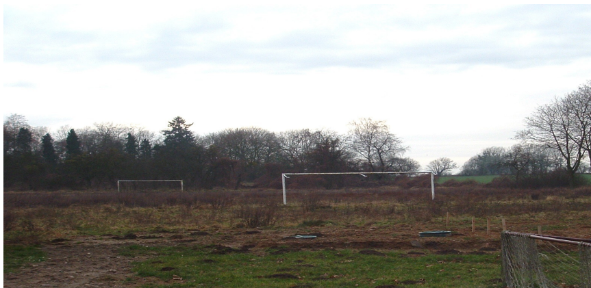
Boisko sportowe w Krajniku Górnym

We wsi znajduje się także boisko sportowe (działka nr 43 o powierzchni 1,65 ha, obręb Krajnik Górny), lecz wymaga ono modernizacji. Przyczyni się to do poprawy dostępności do bazy sportowej, da szansę na stworzenie komfortowego zaplecza dla mieszkańców chcących aktywnie spędzać wolny czas uprawiając sport, pozwoli propagować zdrowy model życia tak wśród dzieci i młodzieży, jak i dorosłych mieszkańców wsi.