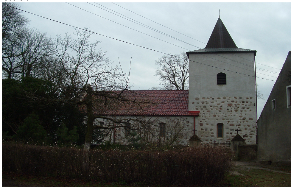
Kościół w Krajniku Górnym