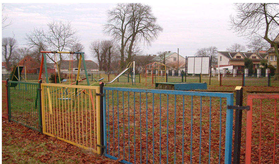
Plac zabaw w Krajniku Górnym