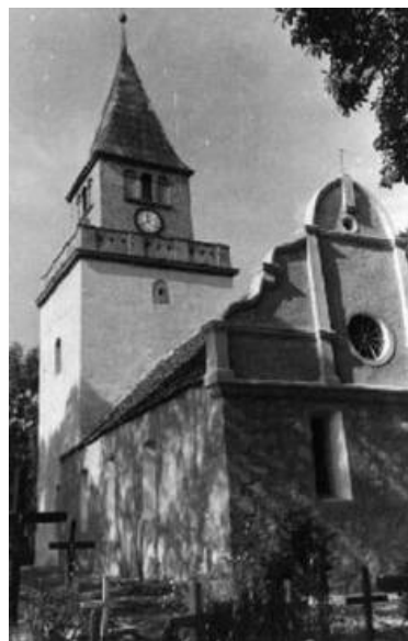
wygląd pierwotny kościoła

adanie będzie wykonywane w dwóch etapach: