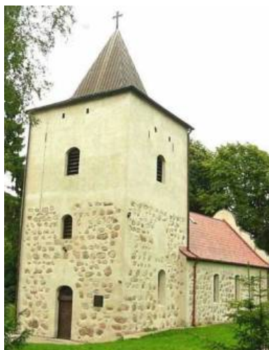
wygląd aktualny kościoła