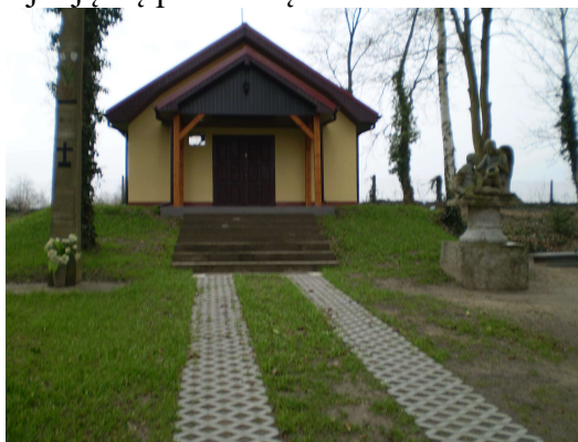
Kaplica cmentarna w Lisim Polu.

Kaplica na cmentarzu przy drodze do wsi Nawodna – wybudowany w czynie społecznym z inicjatywy Społecznego Komitetu Budowy Kaplicy zorganizowanego w 2005 r. Odwodnienia wymaga teren cmentarza położony w niszy, co sprawia, że podczas ulewnych deszczów i topnienia śniegu groby znajdują się pod wodą.