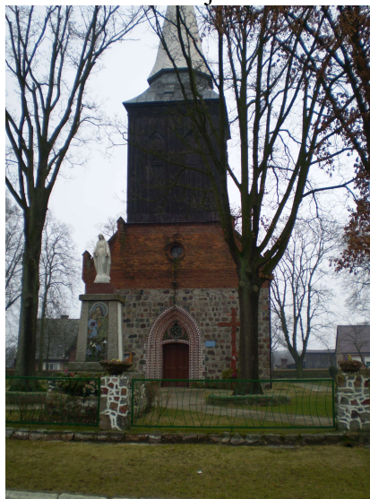
Fot. Kościół filialny w Lisim Polu

Kościół - dobra parafii odnotowane w końcu XVII w., w 1868 r. ewangelicki kościół parafialny. Wzniesiony w XIII/XIV w. z granitowej kostki został przebudowany w 1893r. Nadbudowano wówczas drewnianą dzwonicę i dostawiono wieloboczne prezbiterium. Obecnie jest to kościół filialny parafii w Nawodnej.