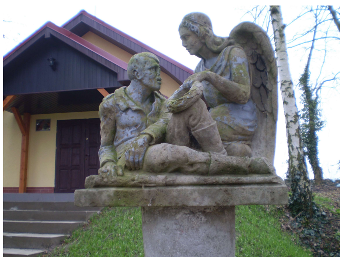
Fot. Pomnik poświęcony żołnierzom I wojny światowej w Lisim Polu

Na cmentarzu komunalnym położonym na zachodnim krańcu wsi znajduje się pomnik poległych na I wojnie światowej, który przedstawia anioła pochylonego nad rannym żołnierzem. W ostatnich dwóch latach mieszkańcy wybudowali kaplicę cmentarną, wcześniej ogrodzono teren i doprowadzono wodę.