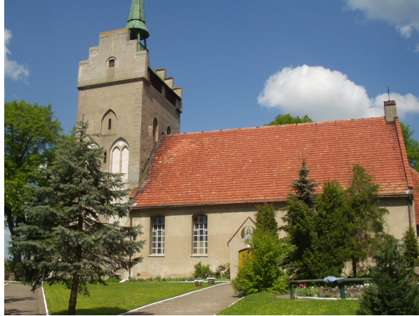
Rys. 2 Kościół z przełomu XIV/XV w.

Kościół - parafia z filiami w Grabowie i Garnowie wzmiankowana w 1545 r.; później filia parafii ewangelickiej w Chojnie; późnogotycka budowla kamienna datowana na XIV/XV w.; wieża dobudowana później (XV/XVI w.); przebudowana po pożarze ok. 1723 r. Po kolejnym pożarze w 1964 r. kościół odbudowano w 1966 r., zmieniono wówczas formę zwieńczenia wieży.