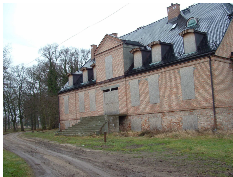
Dwór w Rurce- stan obecny