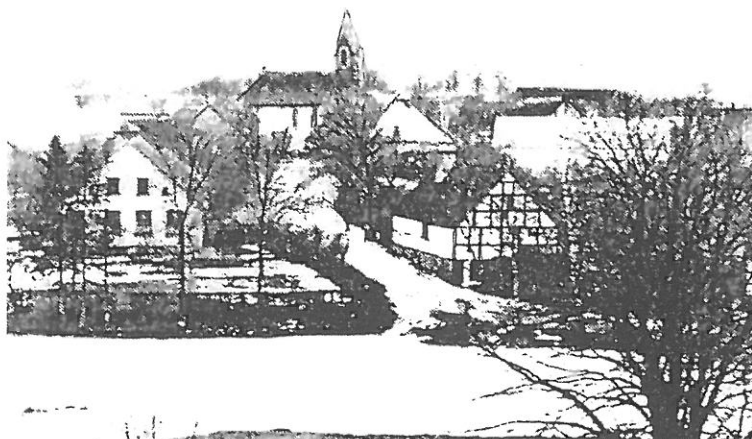
Rys. 1 Wieś Czartoryja – widok od strony północnej (stan z l. 30-tych XX w.)