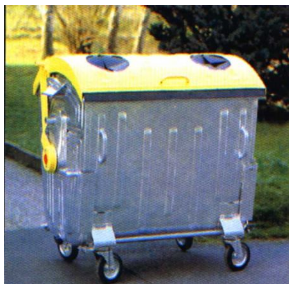
Przykład pojemnika o pojemności 1100 l do selektywnej zbiórki szkła