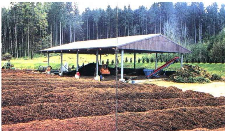
Przykład Kompostowni pryzmowej