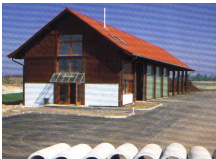
Przykład Kompostowni zamkniętej